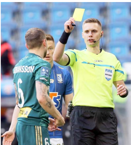
POLSKI ZWIĄZEK PIŁKI NOŻNEJ

Na pytanie o liczbę spotkań na najwyższym poziomie wrocławianin tylko nieznacznie się pomylił: – Myślę, że mój licznik wskazuje teraz około 60 meczów. Nie przywiązuję do statystyk dużej wagi, ale znam osoby dla których to ważne, więc nie dziwi mnie to pytanie. Ze wszystkich informacji czy statystyk jedynie liczba spotkań wydaje się istotna. Pokazuje, że już ich trochę jest za mną. Zwłaszcza jeśli wziąć pod uwagę fakt, że część z tych meczów to spotkania, na które trzeba trochę poczekać będąc już nawet na najwyższym poziomie. To też pokazuje, że